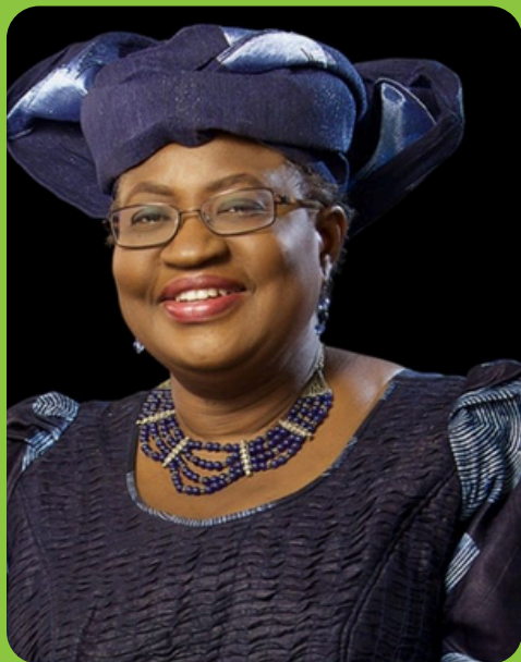
Ngozi Okonjo-Iweala Economista Actual Directora-Geral da OMC

Nesta palestra, Ngozi Okonjo-Iweala partilha uma reflexão sobre os factores que podem sustentar o crescimento económico do continente africano.